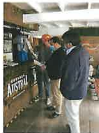
FISCALIZACIONES A LOCALLES COMERCIALES EN CUMPLIMIENTO A PATENTES COMERCIALES, NORMAS SANITARIAS Y COORDINACIONES POR DENUNCIAS DE VECINOS