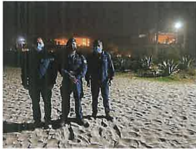
RONDAS NOCTURNAS JUNTO A POLICIA MARITIMA EN PLAYAS DE LA COMUNA