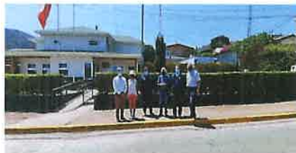
VISITA DE LOS INTEGRANTES DE JUNTA DE VECINOS DE ZAPALLAR AL FUNCIONAMIENTO Y TRABAJO DEL CENTRAL CAMARAS