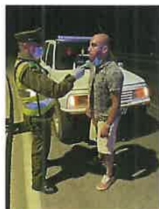
OPERATIVOS DE LA SIAT DE CARABINEROS DE LA PROVINCIA EN ZAPALLAR Y CATAPILCO