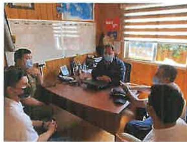
RECEPCION Y COORDINACION DE LA PLANIFICACION DE FUNCIONAMIENTO DEL EQUIPO DE POLICIA MARITIMA, EMERGENCIA MUNICIPAL Y CARABINEROS ASIGNADOS PARA VERANO 2022