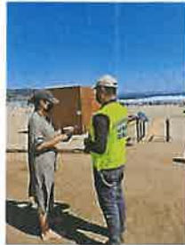
ENTREGA DE VOLANTES INFORMATIVOS Y EDUCACIÓN SANITARIA