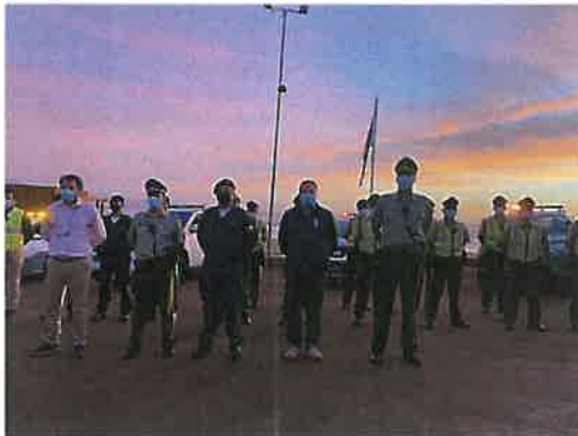
OPERATIVOS CONJUNTOS DE LA ARMADA Y CARABINEROS EN RONDAS NOCTURNAS, JUNTO A PERSONAL DE TURNO DE DIRECTORES, COORDINADORES, PATRULLEROS E INSPECTORES MUNICIPALES